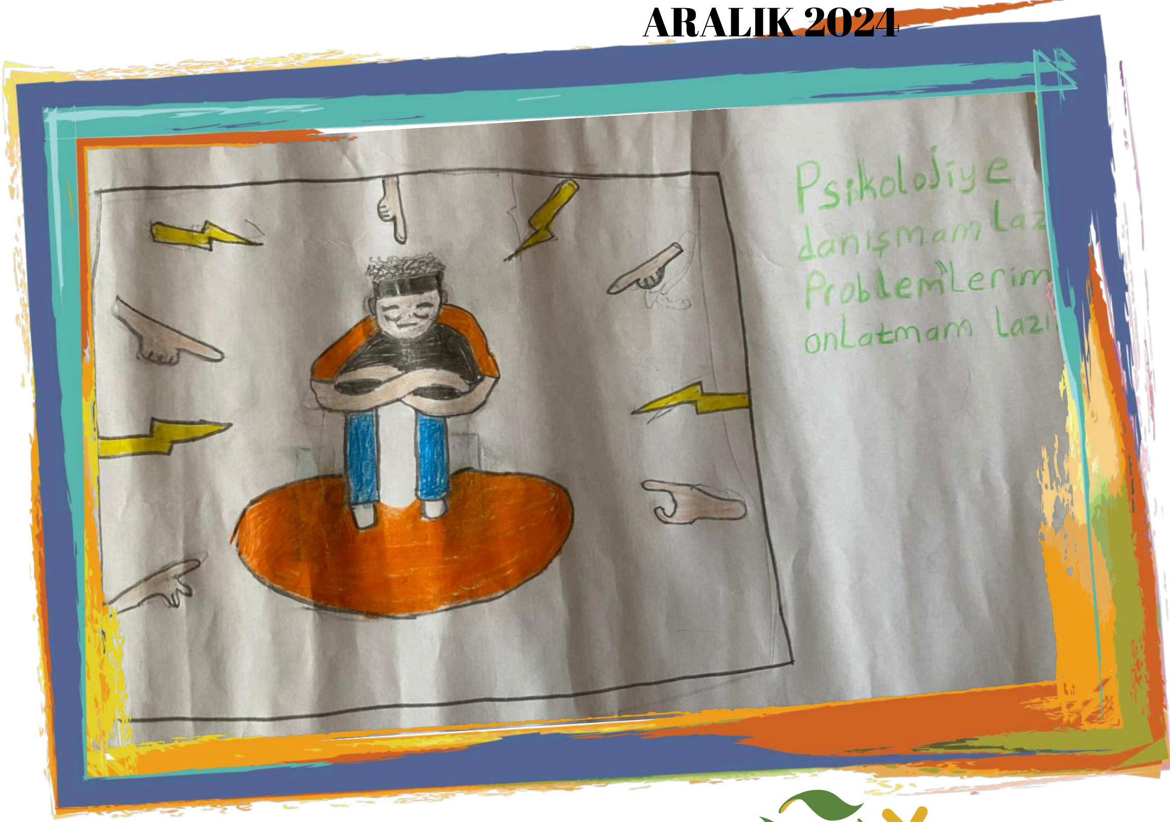
"AKRAN ZORBALIĞI" YAĞMUR TAŞDEMİR 5 / C