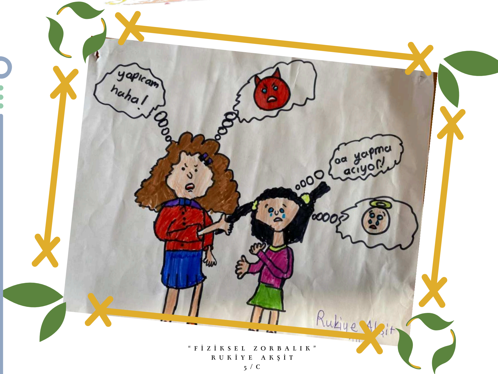
"FİZİKSEL ZORBALIK" RUKİYE AKŞİT 5 / C