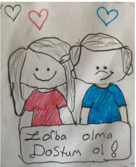
Pelin AKPINAR 6/B

Onlar bizim dostumu, kardeşimiz gibi gereksiz yere kavga, dövüş olmasın kendimizi koruyalım.